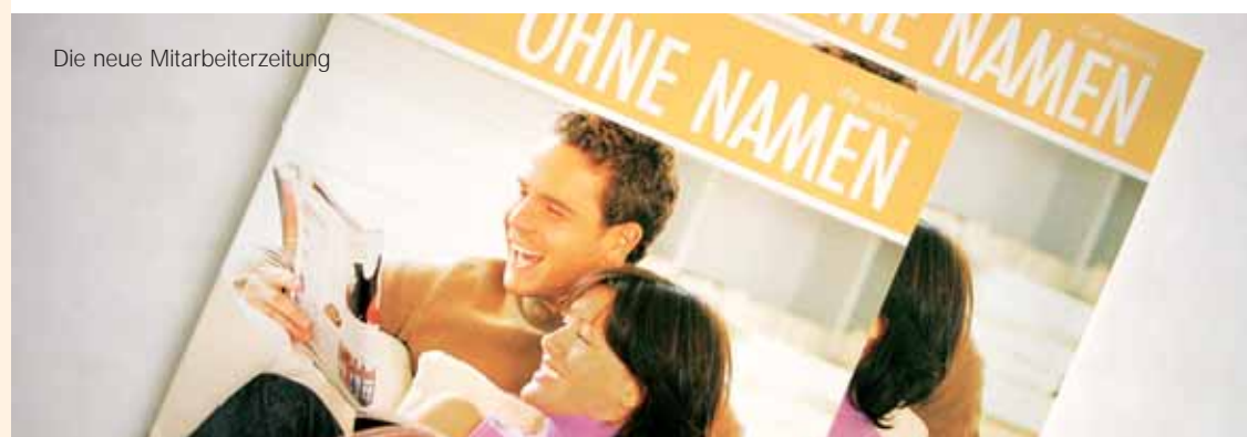
Die neue Mitarbeiterzeitung

Die Mitarbeiterzeitung soll das Geschehen im Unternehmen verständlich machen und natürlich auch etwas Farbe und Leben in die Weyland-Familie bringen!