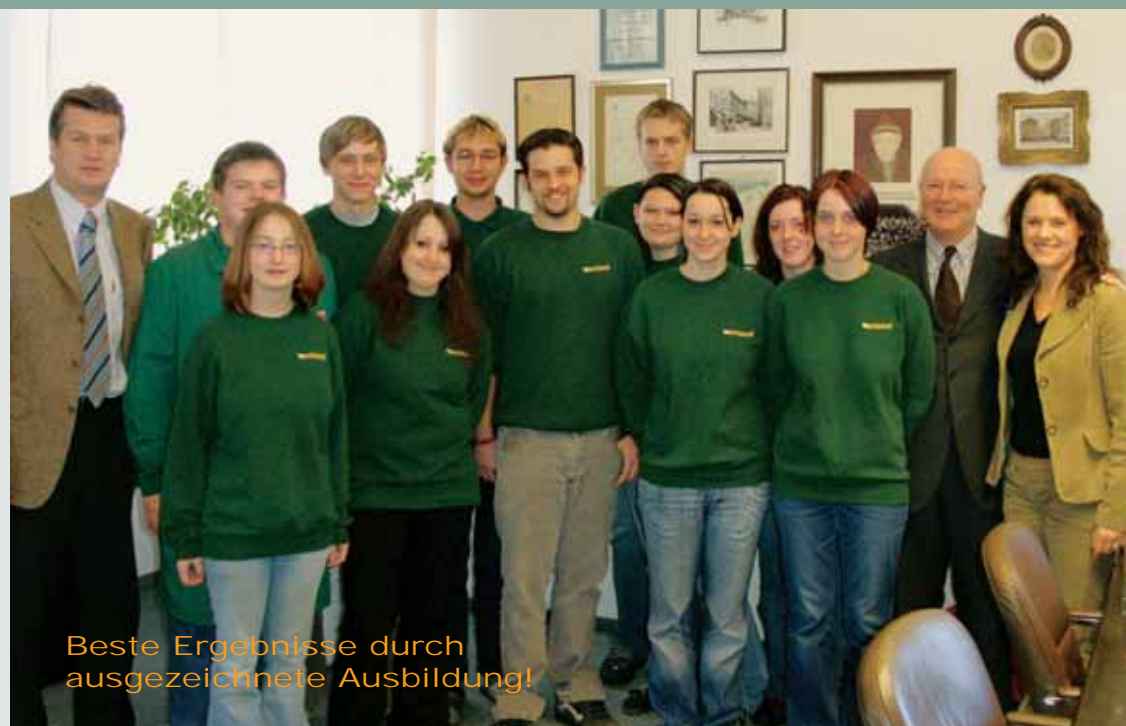
Beste Ergebnisse durch ausgezeichnete Ausbildung!